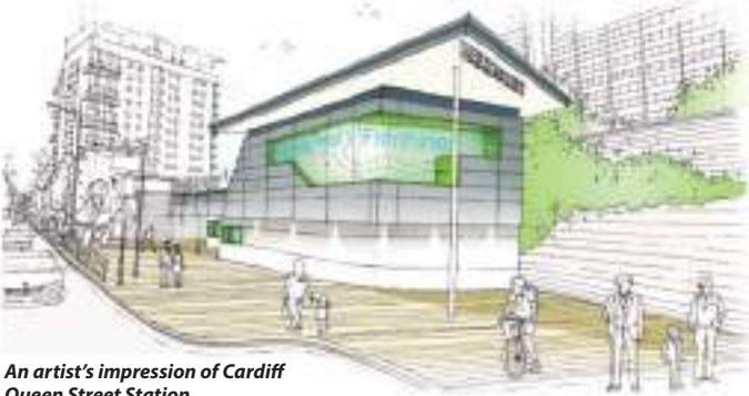
An artist's impression of Cardiff Queen Street Station

You will soon see work starting on improvements to the rail network all around the Cardiff and Valleys area.